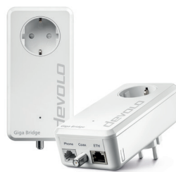
Giga Bridge Phoneline 08858 (NL, ES, PT, LU)