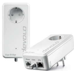
Giga Bridge Coax 08860 (DE, AT, NL, ES, PT)